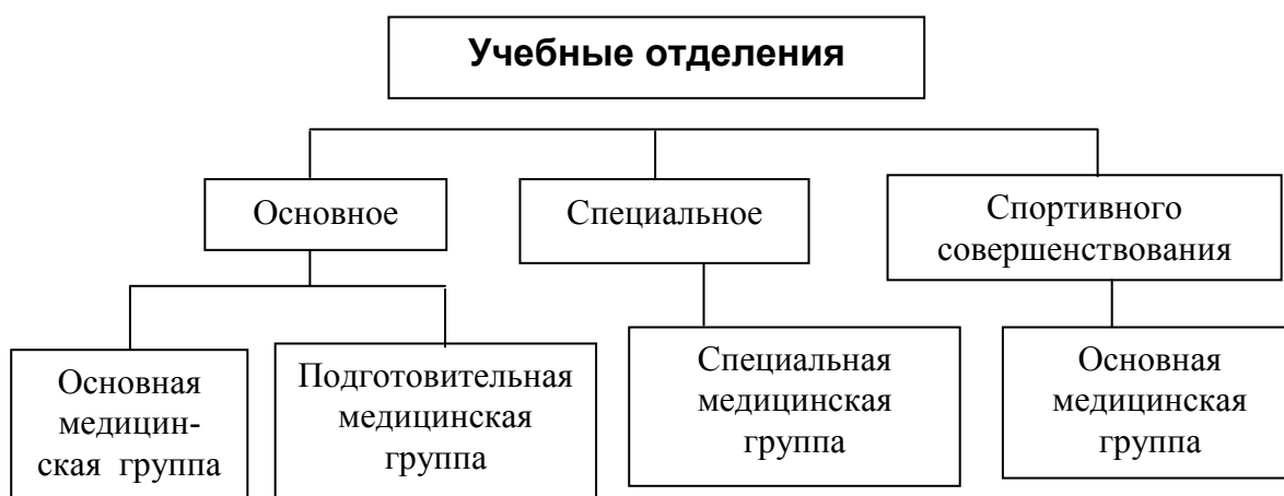
Рис. 1.2. Распределение студентов по учебным отделениям

Для проведения занятий по физическому воспитанию все студенты по результатам медицинского обследования распределяются по учебным отделениям: основное, спортивное и специальное (рис. 1.2). Распределение проводится в начале учебного года с учетом пола, состояния здоровья, физического развития, физической и спортивно-технической подготовленности, интересов студента. На основе этих показателей каждый студент попадает в одно из трех отделений для прохождения обязательного курса физического воспитания. Каждое отделение имеет определенное содержание и целевую направленность занятий.